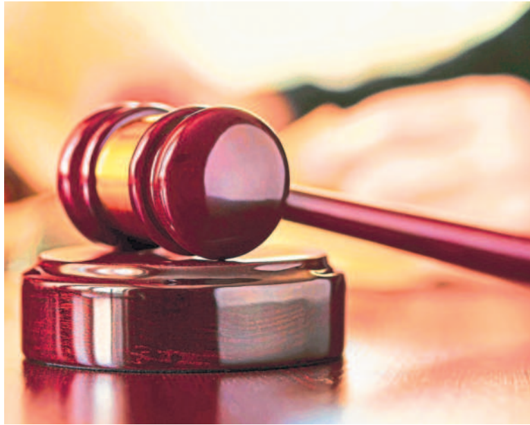
In FY25, the spending was up a little over 14% at ₹60,000 crore.

"We are seeing higher legal advisory and compliance spending in FY26