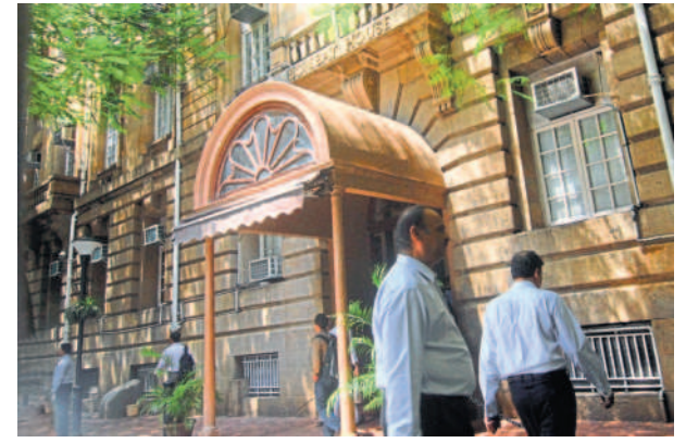
A clarification by the Reserve Bank of India has undercut Tata Sons' attempt to distance itself from public funds.

A former regulator said the earlier argument that Tata Sons does not have public funds and can therefore give